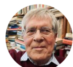
Af Erik Christensen