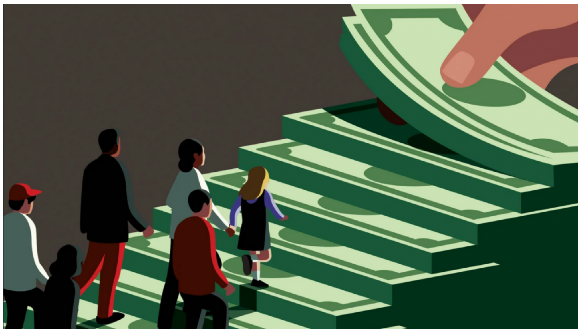
Borgerlønnen kan skabe en mere positiv forudsætning for arbejdssøgende, og vil gøre arbejde til en ret frem for en pligt, mener dagens kroniker.