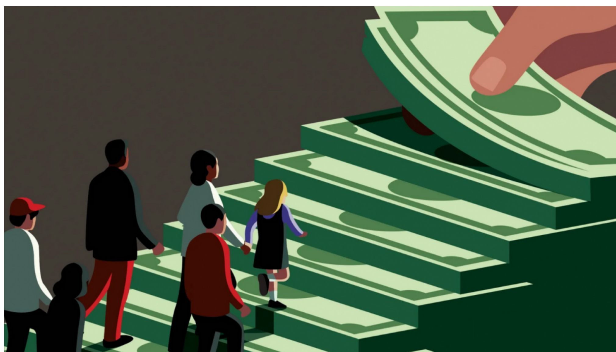
Borgerløn kan skabe en mere positiv forudsætning for arbejdssagende, og vil gøre arbejde til en ret frem for en pligt, mener dagens kroniker.